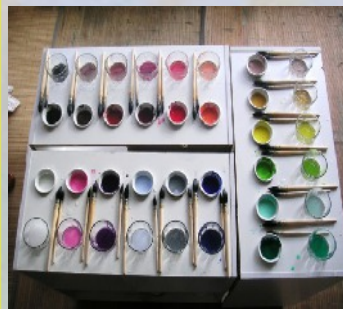
Jeu de peindre

Comme un enfant qui peint un enfant qui joue un enfant qui rit